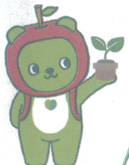
長野県PRキャラクター 「アルクマ」 ©長野県アルクマ

平成28年度松本地区(第67回全国植樹祭県民植樹)実行委員会 長野県松本地方事務所 中信森林管理署 松本市 塩尻市 安曇野市 麻績村 生坂村 山形村 朝日村 筑北村 松本地域森林林業振興会 松本広域森林組合 松筑木材協同組合 南安曇木材協同組合 松塩筑猟友会 安曇野市猟友会 長野県山林種苗協同組合波田支部 長野県山林種苗協同組合山形支部 松本林業士会