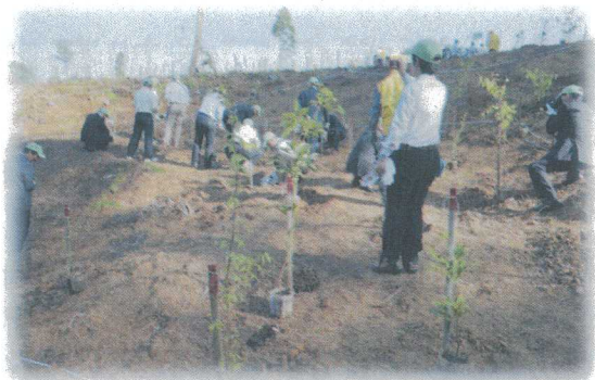
平成 27 年度 第 66 回全国植樹祭石川大会の植樹の様子