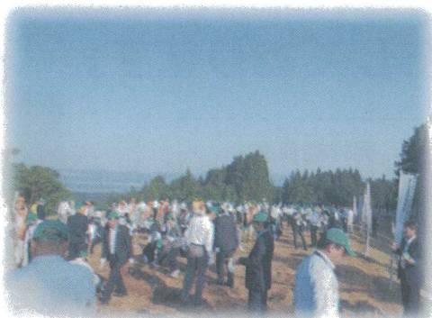
平成 26 年度 第 65 回全国植樹祭新潟大会の植樹の様子